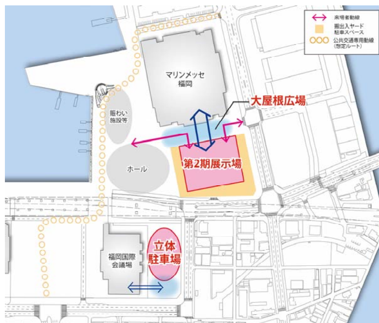
図表 7 機能配置図 (イメージ)