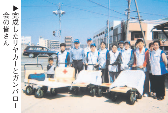
完成したリヤカーとガンパロー会の皆さん

申 両講座とも、はがきか電話、ファクスで、講座名、住所、氏名(ふりがな)、年齢、電話番号を書いて6日(金)必着)までに同センターへ。応募多数のときは抽選。