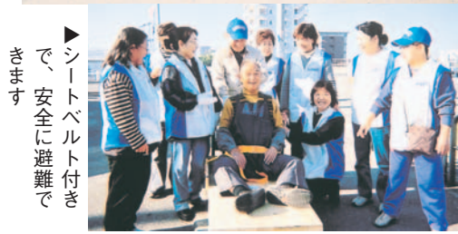
シートベルト付きで、安全に避難できます