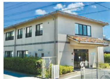
カラフルな入り口の屋根が目印です

職員には守秘義務があります。プライバシーは守られます。安心して相談してください。 詳細は市ホームページ(福岡市 区障がい者基