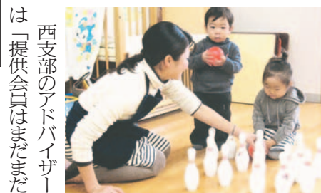
提供会員宅で遊ぶ子どもたち

西支部のアドバイザーは「提供会員はまだ不足しています。子育て中の人も、子育てが一段落した人も、子育て経験のない人も、地域での子育てを援をしてみまんかと呼び援をしてみまんかと呼び援をしてみま