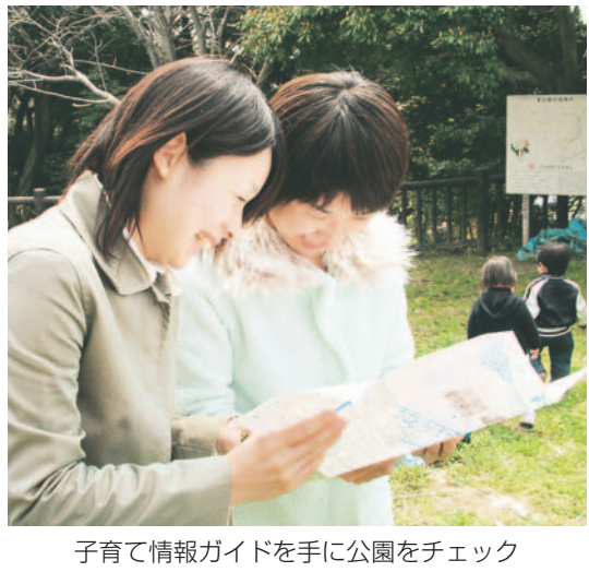
子育て情報ガイドを手に公園をチェック

全校区の子育て情報ガイドが完成 近くの公園や医療機関も載っています 区は平成17年の子育てに関するアンケート結果にあった「地域の子育てに関する情報が欲しい」などの区民の声をこらえ、校区ごとの「子育て情報ガイド」を作成してきました。3月末に最後の照会が完了し、全校区の子育て情報ガイドが完成しました。 同ガイドは、育児サークルや公民館での子育て支援事業、保育園や幼稚園、公園や医療機関など、子育てに役立つ情報や地図が載っています。大きさはA3判両面印刷で、折り畳むと母子健康手帳サイズになり持ち運びに便利です。 区と地域の育児サークル・サロンのメンバー、自治会などの役員、保育園や幼稚園の先生など多くの人が意見交換やワークショップ(体験型会議)を行いました。