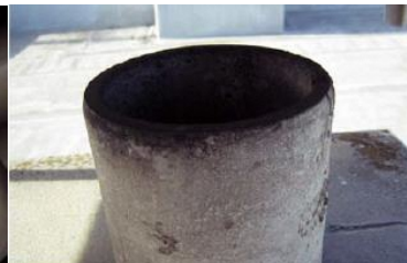
煙突の内側に使用 石綿含有断熱材