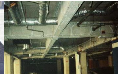
鉄骨を被覆して保護 石綿含有耐火被覆材