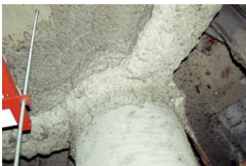
柱や梁に施工 吹付け石綿