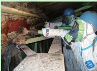
吹付け石綿の除去作業の様子