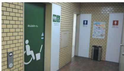
単純化された絵で情報が伝わり、分かりやすくなりました

庁舎1階トイレをリニューアルしました。ユニバーサルデザインの観点から、誰にでもやさしい視覚サインとなるピクトグラムを用いています。