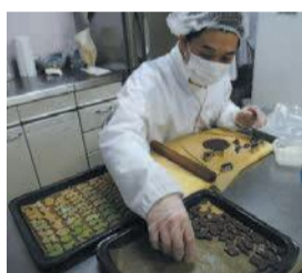
パズルのように、きれいに隙間なく型抜きします

つくし学園では「みんな仲良くおいしいパンを作ろう」を合言葉に、個性豊かなメンバーが、食パン、惣菜パン、菓子パン等を心を込めて作って