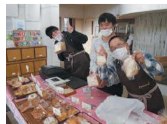
おすすめのパンを作ってお待ちしています

だまされないで! 区役所職員をかたる不審な電話にご注意を! 職員が電話でATMの操作をお願いすることは絶対にありません