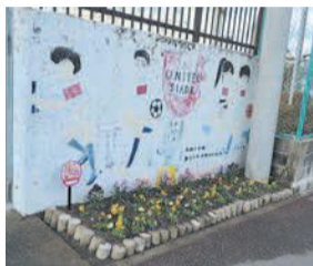
色とりどりの花で卒業生と入学を祝います

3月、4月に花が咲くように、昨年12月18日に別府小学校の花壇の花植えとプランター設置が行われ