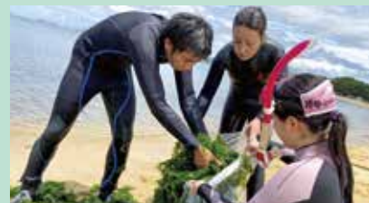
ダイバーのアオサ回収

Eメールアドレス: uminogakko@fun-fukuoka.or.jp 団体HPアドレス: http://fun-fukuoka.or.jp/