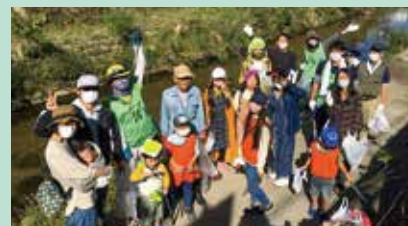
油山川で生きもの探し

TEL:092-871-6631 (福岡大学工学部 社会デザイン工学科 水工学研究室) Eメールアドレス: iyooka@fukuoka-u.ac.jp 団体HPアドレス: https://www.facebook.com/mizutomidorinogakkou/?ref=br_tf&epa=SEARCH_BOX