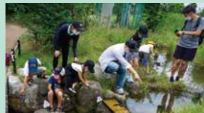
池での観察の様子