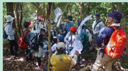
子どもの自然教室

Eメールアドレス: tsutsumi@seinan-gakuin.jp 団体HPアドレス: https://atagoforest.wixsite.com/home