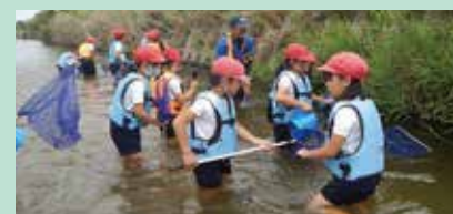
室見川で小学校の環境学習会

Eメールアドレス: yama@fukuoka-u.ac.jp 団体HPアドレス: http://npo-jews.org