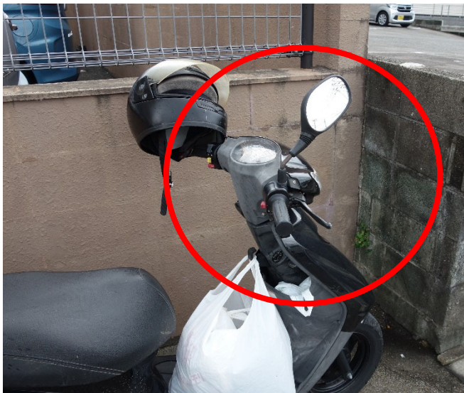
接触に伴うミラーの回転