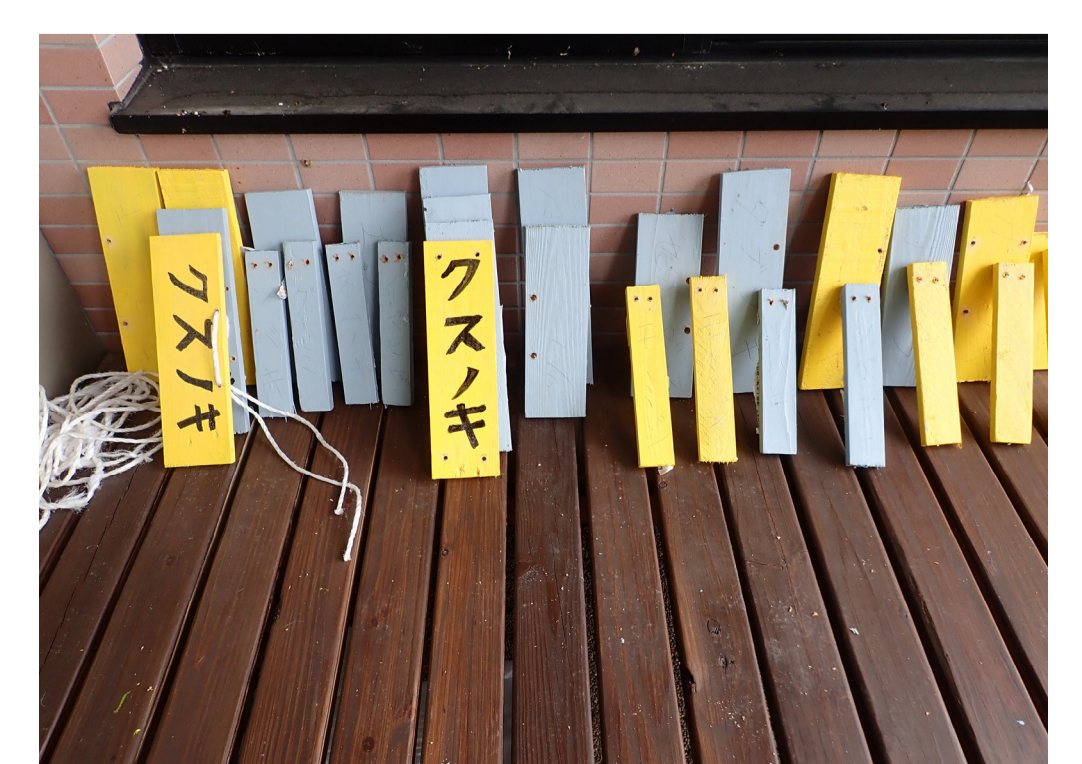
ネームプレート乾燥中