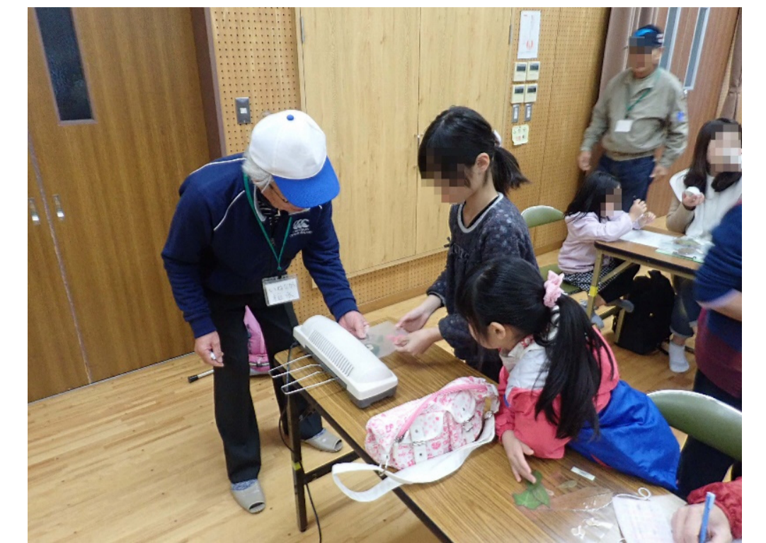
ラミネートでしおり作り