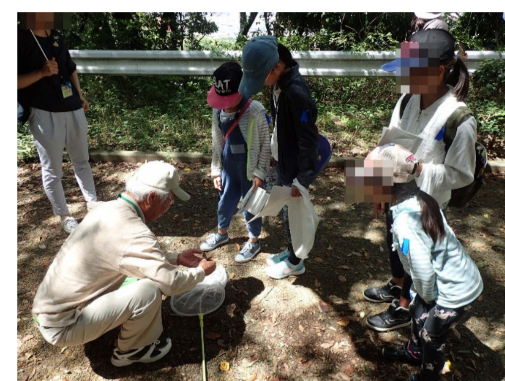
セミを捕まえて観察!