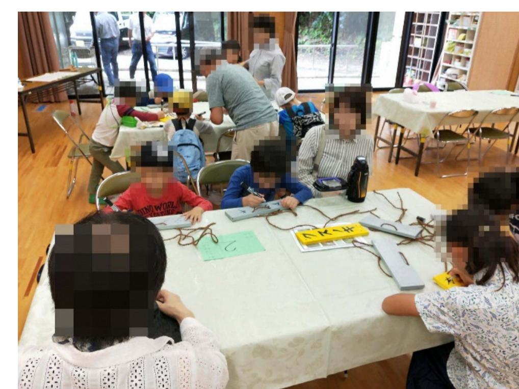
ネームプレート作り