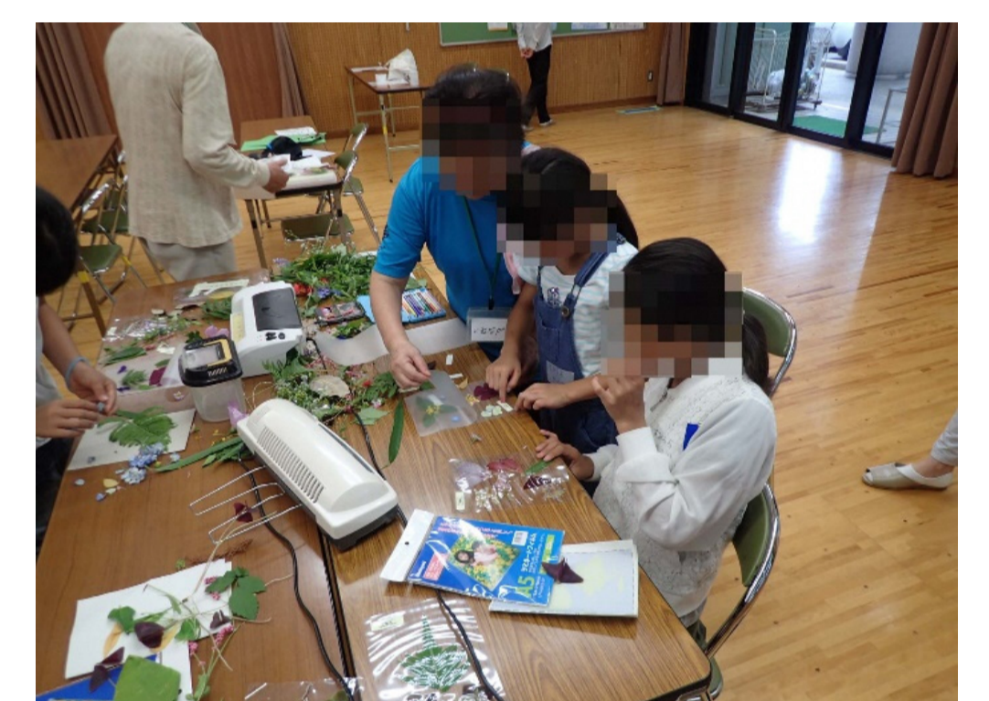
ラミネートでしおり作り