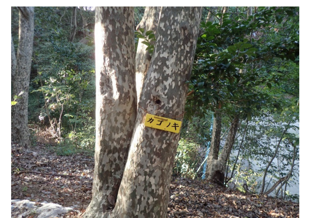
ネームプレート設置