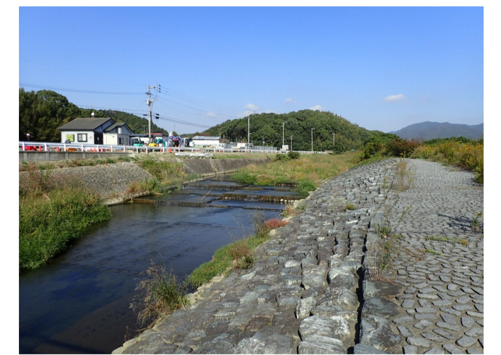
名子地区・蒲田地区の自然