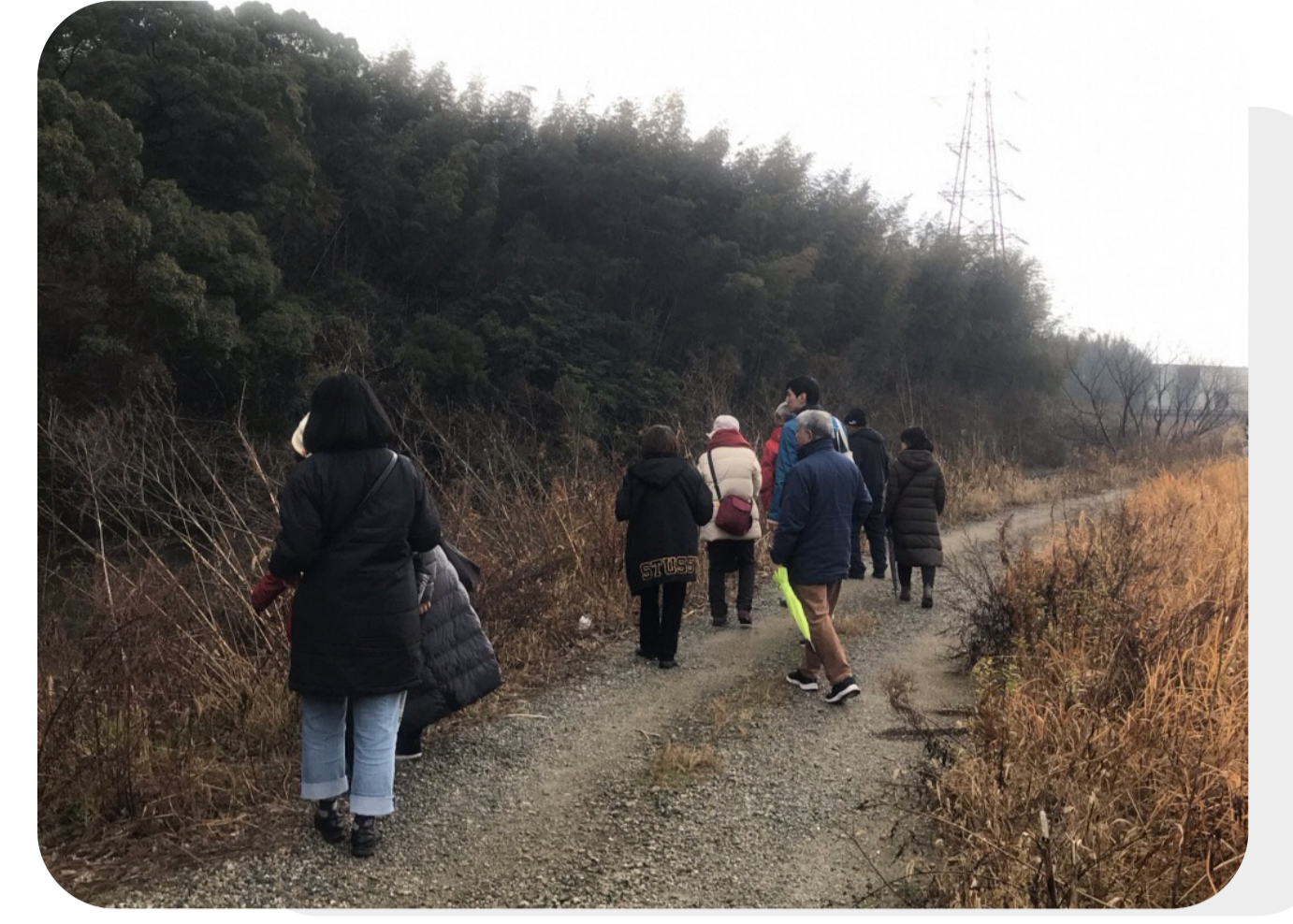
久原川沿いの下見