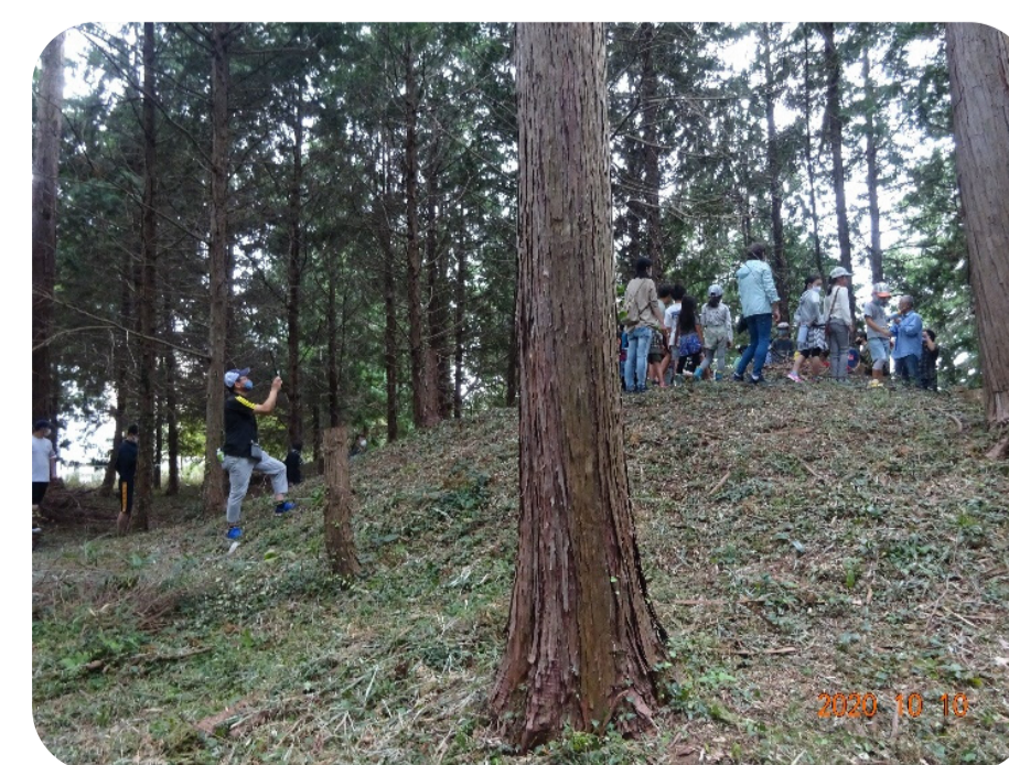
王様の墓(古墳)の説明