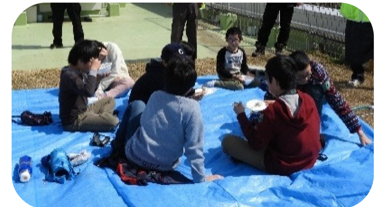
公民館の屋上で昼食