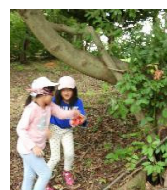
「わたしの木」体験中