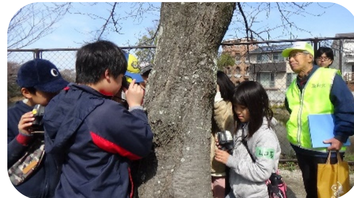
ルーペで樹木の観察中