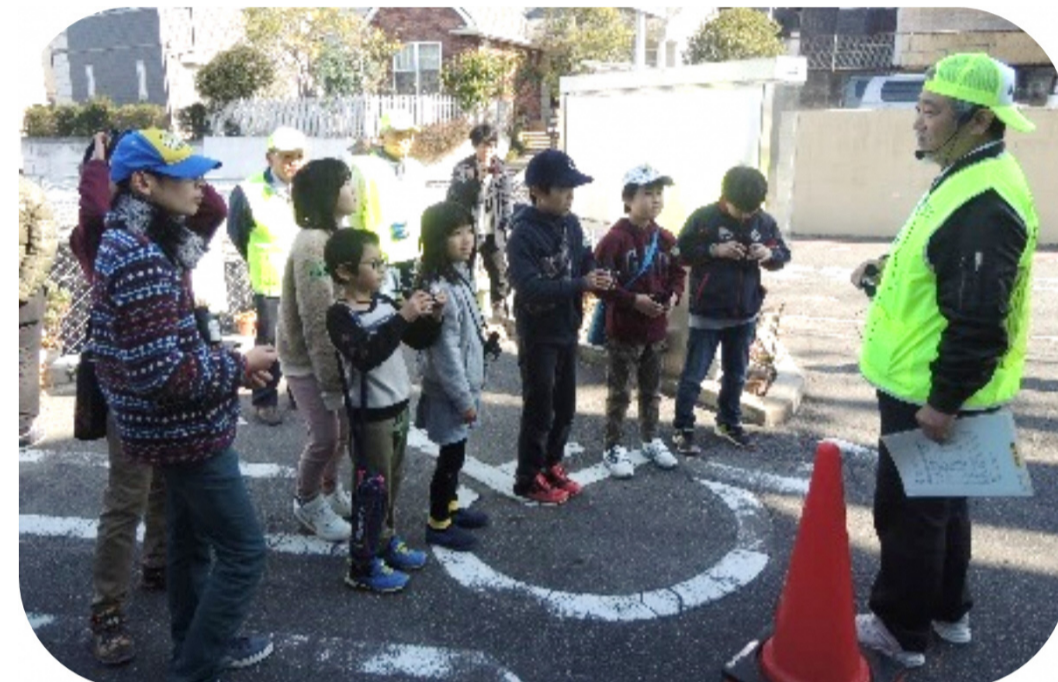
校区の探検に出発！