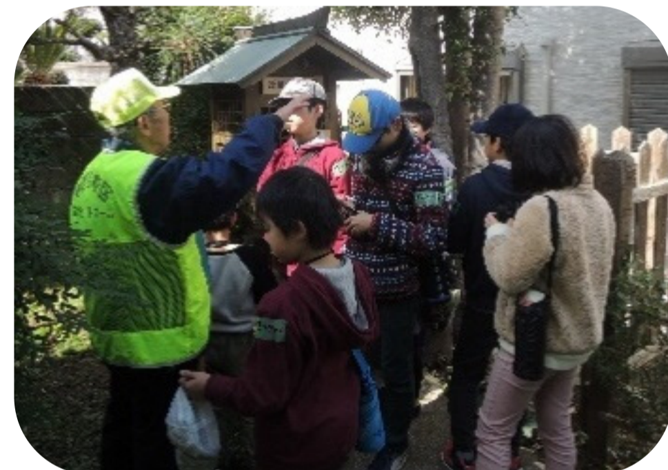
地蔵の由来を聞きました