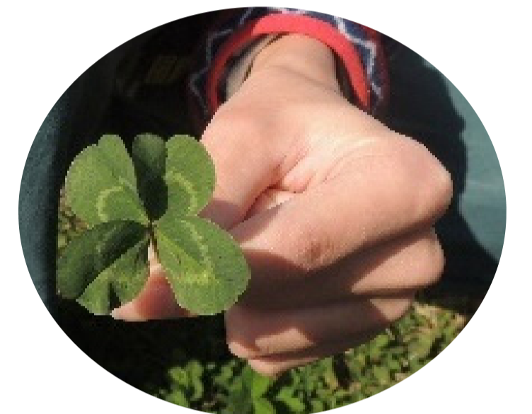
四つ葉のクローバーを発見