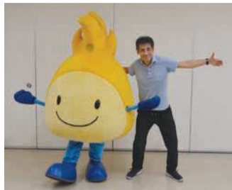
月に2回新しい動画を配信

区では、自宅で簡単にできる運動の動画の配信を始め、区ホームページ(「ニッコりん トレーニング」)でも生き生きと暮らすためには、日頃からの健康づくりが大切です。