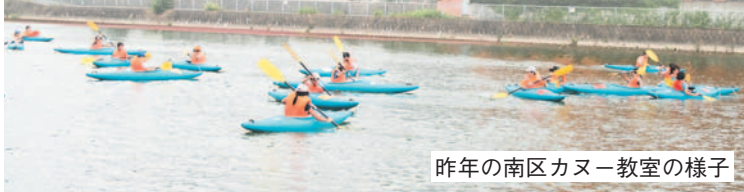
昨年の南区カヌー教室の様子