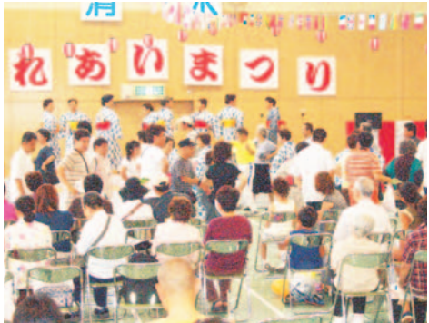
毎回大にぎわいのふれあいステージ

やネイルアート教室など、子どもから大人までみんなで楽しめる内容です。また、作業の見学や体験をすることもできます。 イベント盛りだくさんのこのまつりに、みなさんも足を運んでみてはいかがでしょうか。なお、