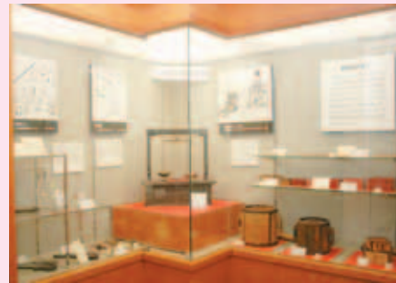
計量の歴史についてのパネル展示も

アジア太平洋博覧会(平成元年開催)のネパール館で展示されていた「ネパール王国のほかり」や、漁村などで小魚を体積で取り引きするために使っていた「けんち枀」などの珍しい計量器も展示しています。