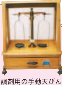
調剤用の手動天びん

しかし、「この色は消費効果のある塩素と試薬が反応して付いただけ。水道水は安心して飲めます」との説明に参加者たちは、大きくうなずいていました。講座は無料です。詳しくは、消費生活センターへ問合せを。