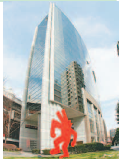
あいれふ7階が消費生活センター