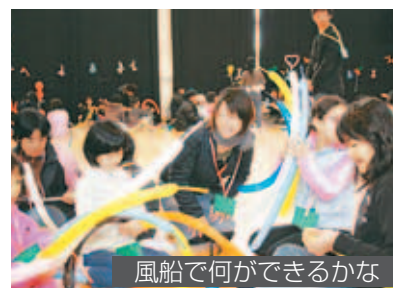
風船で何ができるかな

子どもたちは1つの風船から生まれる犬やウサギに目を輝かせ、学生から作り方を習っていました。また、運動場ではペットボトルロケットの製作も行われ、たくさんのロケットが打ち上げられました。