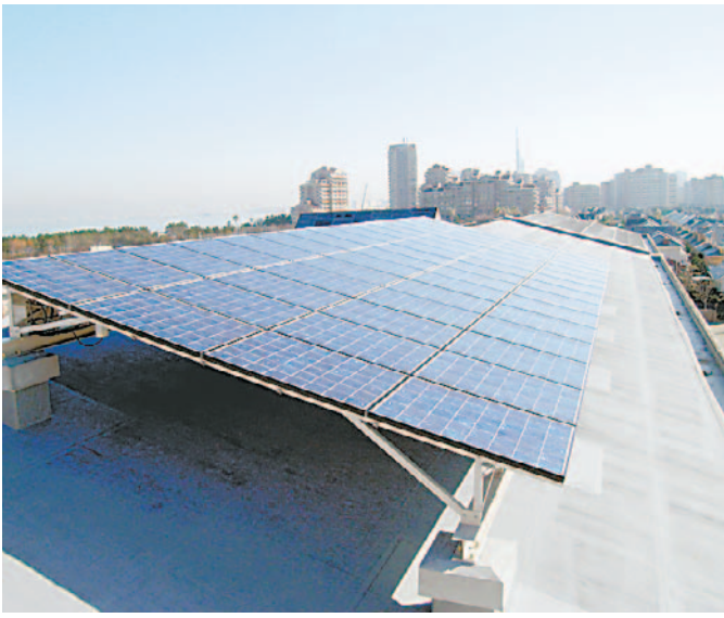
愛宕浜小学校(西区)の屋上に設置された太陽光発電システムは10キロワットの発電能力。パネルの面積は畳約45枚分になる

地球温暖化防止に取り組む市では、新エネルギーの普及を促進するため、住宅に太陽光発電システムの設置を予定している人へ、下記の要領で助成を行います。