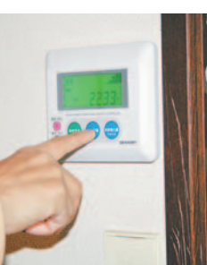
(上) 売電メーターの前に立つ石橋さん夫妻 (下) 太陽光発電システムの室内パネル

【問合せ先】 地球温暖化防止市民協議会事務局(温暖化対策課内) 〒810-0820住所 不要 ☎711-4282 ⑦333-5592 メール loutan.EB@city.fukuoka.jp