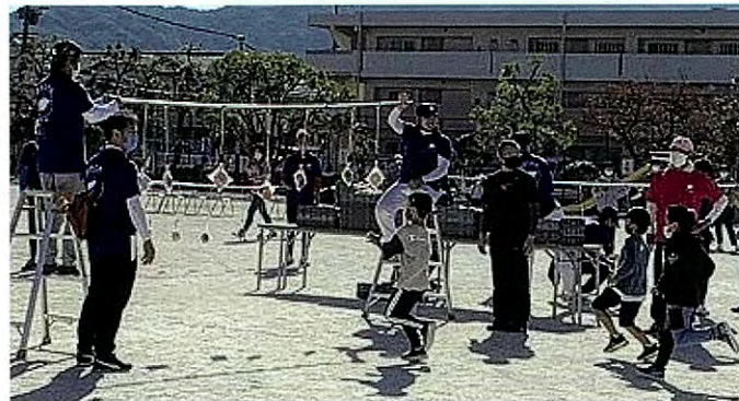
←パン取り競争の様子