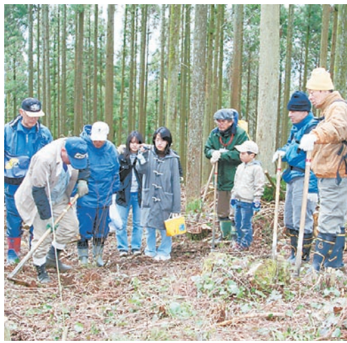
苗木の植え方を教わる参加者

多々良川の魅力を高めるため区が進めている「多々良川ゆめプラン事業」では、3月11日、第6回多々良川リバースクール「山を守る」を開催しました。公募などで集まった約40人は、多々良川上流に位置する篠栗町荒田の山林で、糟屋郡篠栗町の山田一市五町財産組合の協力のもと植林活動を行いました。