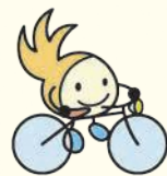
区のシンボルキャラクター 油山の妖精「ニコりん」

〒814-0192 城南区鳥飼六丁目1-1 窓口受付時間:午前8時45分~午後5時15分 (土日・祝日・年末年始を除く) 区ホームページは「福岡市城南区」で検索