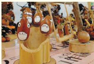
木の実や枝を使った作品(油山市民の森)