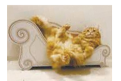
くじ引きの1等「爪とぎソファ」

人気作家による猫グッズの販売や、猫グッズが当たるくじ引き、愛猫のお面作りなどの露店が登場。お酒やソフトドリンクも楽しめます。保護を待つ猫の紹介コーナーもあり。詳細はフェイスブックのイベントページで確認するか、ニャンズにメール(info@nyans.co.jp)で問い合わせを。