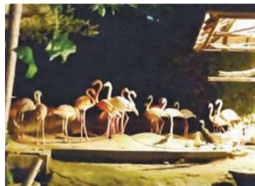
3種類のフラミンゴがいます

動物園では、ライトに映し出されたフラミンゴやペンギンの幻想的な姿のほか、ライオン、トラ、シマウマ等の夜行性動物が活発に動き回る様子など、昼間とは違う動物たちの一面を見ることができます。