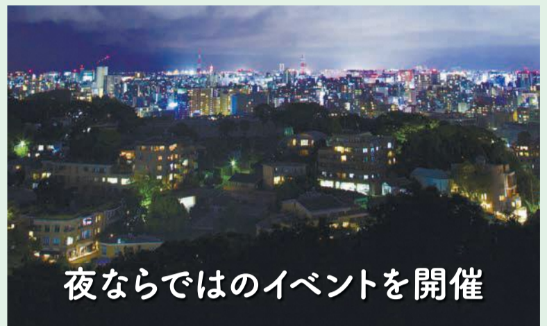
植物園展望台からの夜景