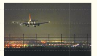
空港コース(約70分)。迫力ある離着陸が見られるかも