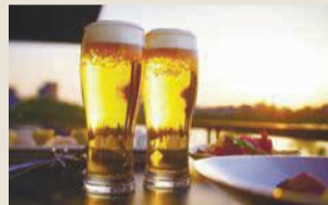
午後5時半から8時半まで実施(オーダーストップは7時半)

市美術館2階のレストラン プルヌスでは、9月29日(日)までビールと地元食材を使った料理が楽しめる「ミュージアム・ビア・プラン」を実施中です。詳しくはレストラン直通電話(983-8050)へお問い合わせを。