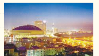
福岡タワーコース(約80分)。博多地区から福岡タワーまで、夜の福岡を満喫

福岡検定に関する問い合わせ先 / 「福岡検定」実行委員会 ☎711-4353 ☎733-5901