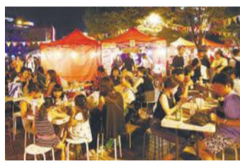
昨年清流公園(博多区中洲一丁目)で開催された同イベント

【飲食】 かき氷、唐揚げ、松きのこの天ぷら、カレー、あまおうソフトクリームなど。