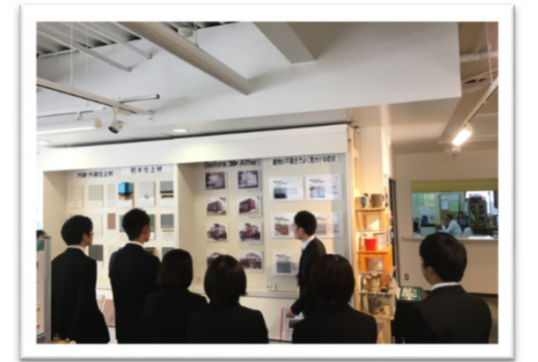
ペインティングギャラリー-見学【(株)ニシイ】

本プログラムは、企業にボランティアとして行っていただくもので、営業活動等をするものではありません。 【発行】福岡市博多区役所 企画振興課 TEL:092-419-1010 FAX:092-434-0053