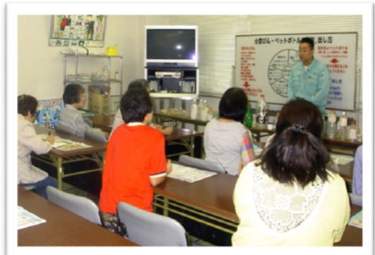
リサイクル施設見学【(株)環境開発 リサイクルプラント】