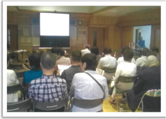
健康教室「ウン知育教室」【福岡ヤクルト販売株】