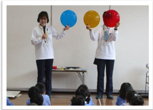
交通安全教室【(一財)福岡県交通安全協会】