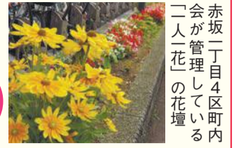
赤坂一丁目4区町内 会が管理している 「二人一花」の花壇

区の人口 201,254人 (前月比93人増) (男89,765人 女111,489人) 世帯数 123,775世帯 (前月比80世帯増) (令和元年7月1日現在推計)