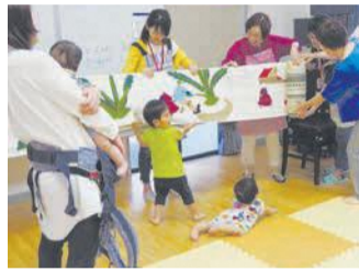
サロン手作りの布絵本を使って、一緒に「うんとこしょ どっこいしょ」