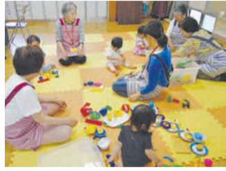
おもちゃで自由に遊ぶ子どもたち