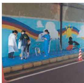
全長約50mの絵を作成

9月22日に、城原小学校や地域から約100人が集まり、福岡女子高等学校美術部が事前に作っ