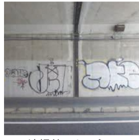
清掃前のトンネル

9月4日から22日にかけて、十郎川橋東交差点下のトンネルの落書きを消し、花をあしらった絵を描きました。このトンネルは、長年落書きで埋め尽くされてきました。住民から「一人一花運動の一環として、落書きを消して花の絵を描けないか」と、区に相談があり、トンネルに「花」を咲かせるプロジェクトが発足。▽国道202号線を管理する国土交通省は落書きを清掃