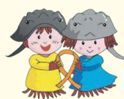
西区子育て応援キャラクターカブーとガニー

「頻りに泣き声や怒鳴り声が聞こえる」など、近所に気になる子どもや家族がいるときは、右記の相談窓口ご連絡してください。連絡者や連絡内容に関する秘密は守られます。