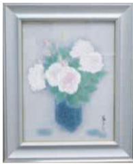
昨年の区長賞作品 (日本画)

11月14日(水)~18日(日)に西市民センターで開催する「西区市民美術展」の作品を募集します。