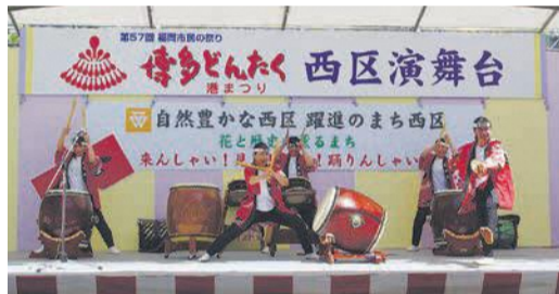
「花鼓周」による太鼓の演奏(昨年)

期5月3日(金・祝)、4日(土・祝)午前10時半～午後4時 所西区演舞台(区役所駐車場) 対区内に住むか通勤・通学する人 定抽選で各日15組程度 料区ホームページ、区企画振興課や区内各公民館で配布する申込書に記入し、郵送、ファクスまたはメールで3月22日(金)必着で西区イベント推進会議事務局(〒819-8501住所不要、区企画振興課内 ☎895-7033 885-0467 shinko.event24@city.fukuoka.lg.jp)へ。