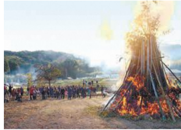
冬の空に火煙が上がります