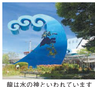
龍は水の神といわれています

皆さん、姪浜駅南口にある、波とウサギをモチーフにした記念碑をご存知ですか。平成元年から20年にかけて行われた土地区画整理事業を機に、姪浜地区が西区の中心として発展してほしいとの願いを込めて、平成13年に作られたものです。伝説には「龍王うさぎ」という逸話があり