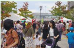
多くの人でにぎわいます