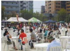
飲食ブースもあります

地域で活動する団体や自然・歴史・文化など、西区が誇る「西区の宝」を一堂に集め紹介... 新たな宝の認定・登録式も行います。