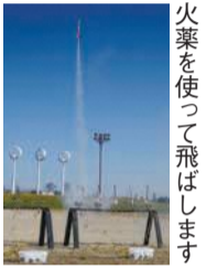
火薬を使って飛ばします

10月28日(日)午前9時半~午後3時半 九州大学伊都キャンパス 区内に住む小学1年生~中学3年生(小学生は保護者同伴) 抽選で30人 料1,050円 申し込みはがき、ファクスまたはメールに住所、氏名(ふりがな)、年齢、学年、電話番号、同伴する保護者氏名を書いて、9月28日(金)必着で区企画振興課(〒819-8501住所不要) ☎895-7007 ㊟885-0467 ㊤shinko.event24@city.fukuoka.lg.jp)へ。