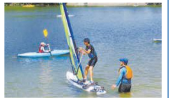
ウィンドサーフィン