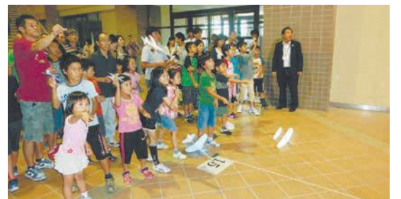
作った紙飛行機を飛ばしてみよう

7月29日(日)午前10時～午後1時 さいとぴあ 小学生(保護者同伴) 抽選で40人 無料 参加費はがき、ファクスまたはメールに住所、氏名(ふりがな)、学年、電話番号、保護者氏名を書いて、7月4日(水)必着で区企画振興課(千819-8501住所不要、☎895-7007 ☎885-0467 ✉shinko.event24@city.fukuoka.lg.jp)へ。