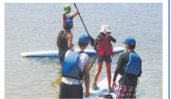
スタンドアップサーフィン