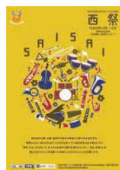
昨年のリーフレット

10月～12月に区内で開催される音楽、舞踊・民舞、演劇、文芸、茶華道、美術、歴史などの行事(11月の行事を優先して掲載) 参加費はがき、ファクスまたはメールに部門名、行事名、日時、会場、内容(資料があれば添付)、参加費の有無、主催者名、問い合わせ先の住所、電話番号を書いて、7月13日(金)必着で同事務局(千819-8501住所不要、区企画振興課内 ☎895-7032 ☎885-0467 ✉shinko.NWO@city.fukuoka.lg.jp)へ。