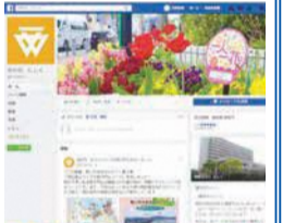
「ぷらり」とご覧下さい

区フェイスブックページ「ぷらり にしく」(www.facebook.com/f.nishiku)では、市政だよりや区ホームページに掲載していない情報を随時発信中です。アクセス方法などは16面上部をご覧ください。