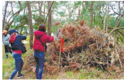
たくさんの枯れ枝を集めました