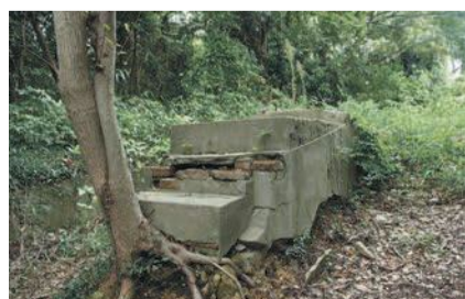
コンクリートが残る山上駅跡

皆さん、愛宕神社に参拝者のケーブルカーII上写真IIがあったことをご存知ですか。このケーブルカーは昭和3年に開業した8人乗りの箱型車両2台で、愛宕山山頂と明治通り間約100メートルをおよそ2分で往復していました。