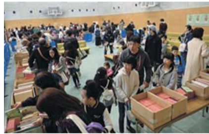
1000冊以上の本があります

無料の古本市です。気に入った本があれば自由に持ち帰れます。「うちでは読まないけど誰かに読んでほしい」といった本の引き取りも行います。