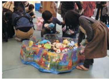
好きなおもちゃはあるかな

マイ小型家電を分解してキーホルダーを作ろう 使用済みの小型家電を分解し、部品を使って自