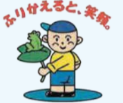
ふりかえると、実現。市口座振替促進マスコット「ふりかえるくん」

利用には、地方銀行の普通預金口座(個人名義に限る)が必要です。詳しくは、市ホームページ(「福岡市インターネット口座振替」で検索)でご確認ください。なお、納税通知書に同封のがき、または区課税課や金融機関窓口へ備え付けの口座振替依頼書でも申し込みます。