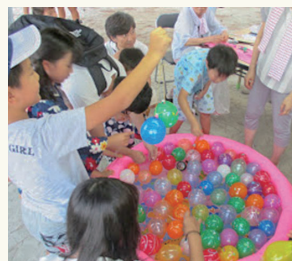
ヨーヨー釣りは大人気