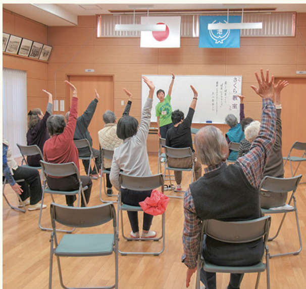
健康づくり教室で体を動かそう