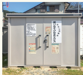
リサイクルボックスを管理