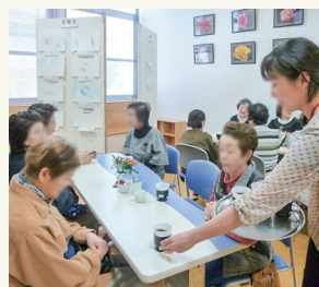
みんなで楽しくおしゃべり