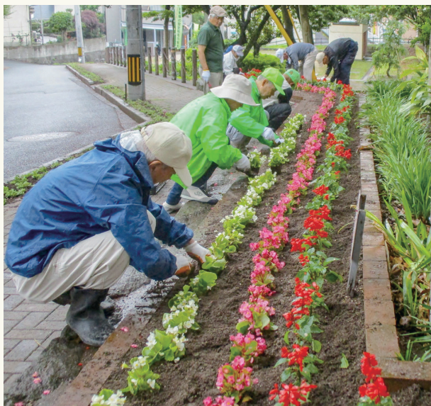
たくさんの花とみどりでまちが明るく