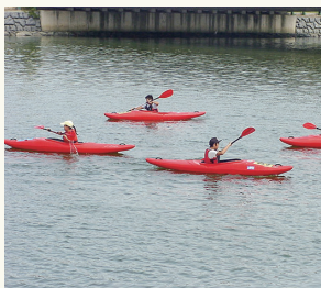
カヌーは楽しい屋外体験