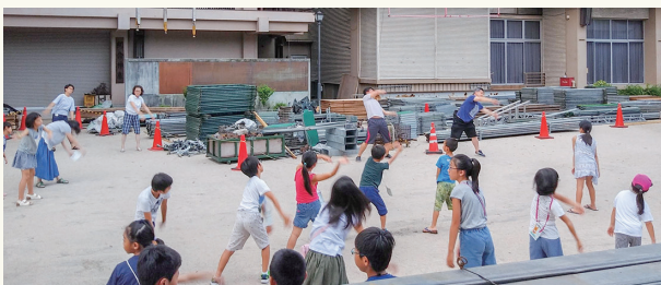
みんな集まれ！ラジオ体操