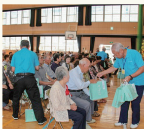
長寿を祝う、年に一度の敬老会