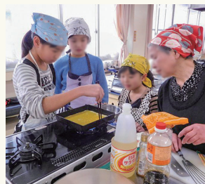
真剣な表情で料理