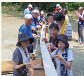
夏のお楽しみ、そうめん流し