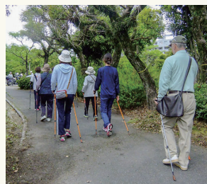
自然の中をウォーキング