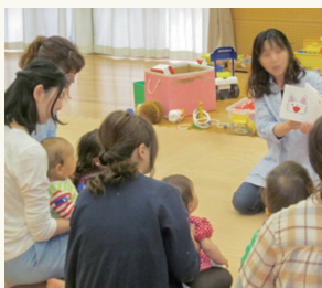
子育て交流サロンの読み聞かせ