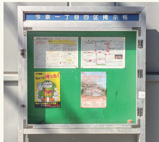
回覧板や掲示板で広くお知らせ