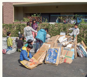
古紙などを集団回収