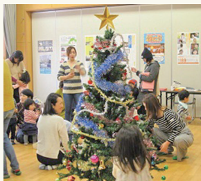
みんなでクリスマスツリー飾り