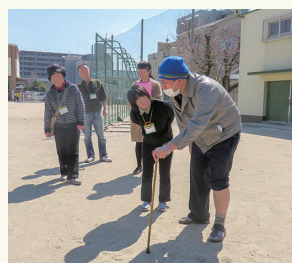
認知症見守り・声かけ訓練