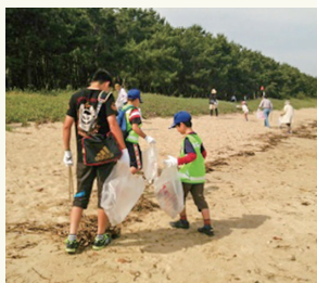
みんなで町内を一斉清掃、海岸や公園もきれいに