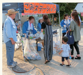
ごみをしっかり分別