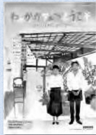
企画:東京都教育委員会 制作:東映株式会社教育像部

ココロンセンターだより No.72 発行:平成30年6月 福岡市人権啓発センター