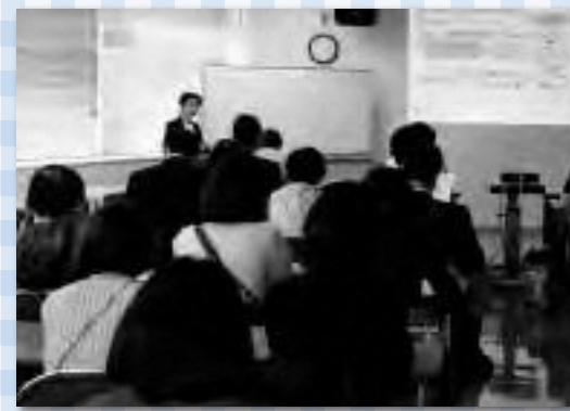
昨年度開かれたココロセミナー