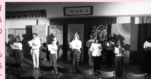
朗読劇をする地域住民

「もっと深く、もっと分かりやすく」。DVDも朗読劇も人権へのそんな思いが形になったものです。年間活動である人権標語募集や講演会、広報紙づくりなどもそのように心掛けています。