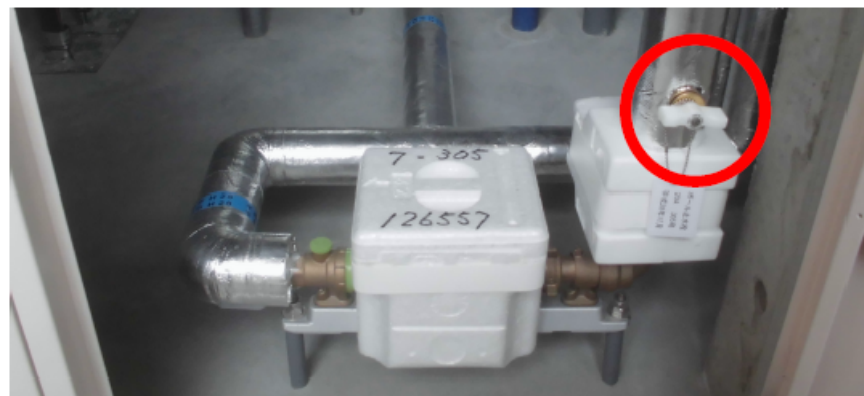
メンテナンスボックス内写真