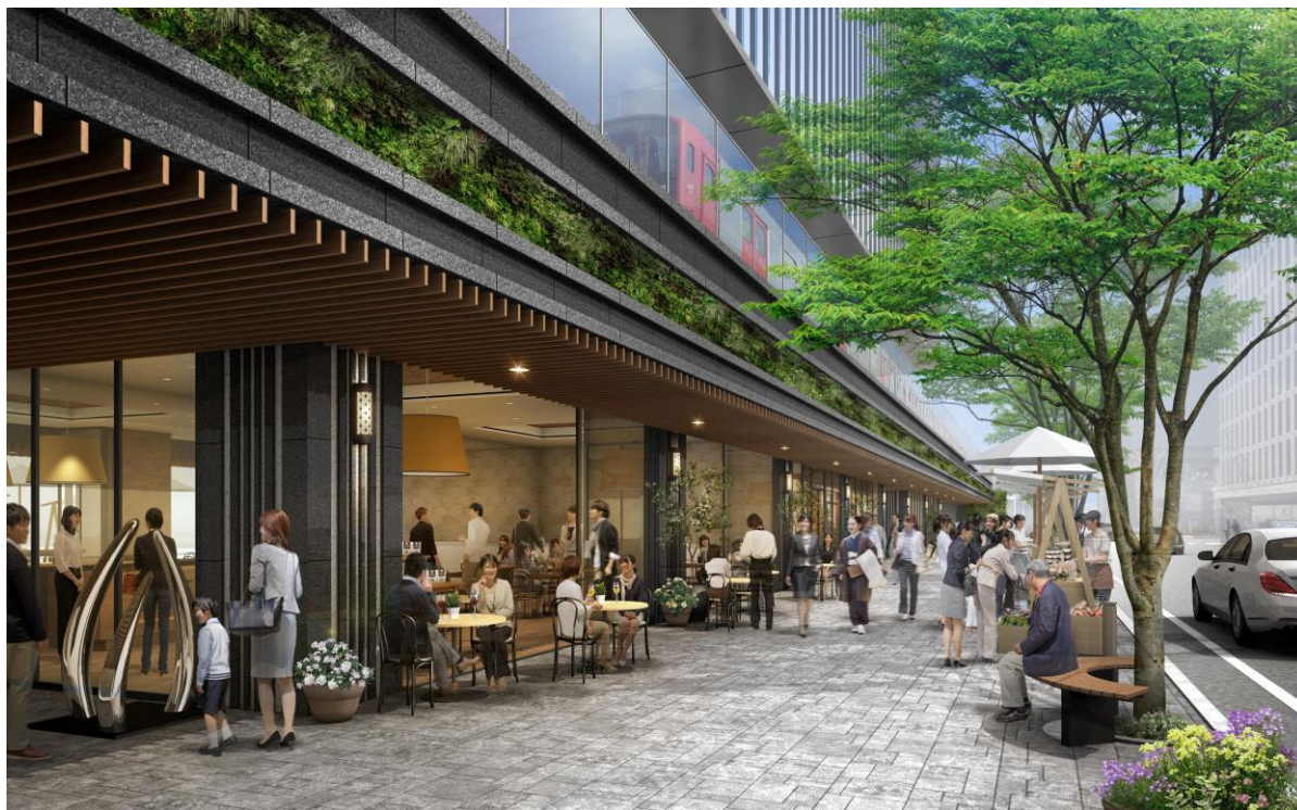
KITTE 博多側から竹下駅側を望む