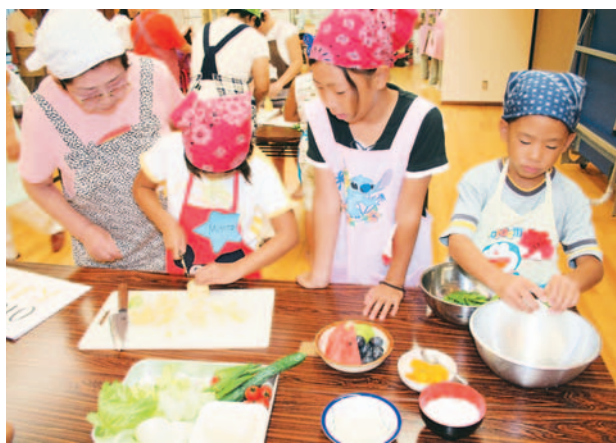
真剣なまなざしで料理に挑戦する子どもたち

下山門公民館で8月27日、料理作りを通して食の大切さを見直してもらおうと、西区食生活改善推進員