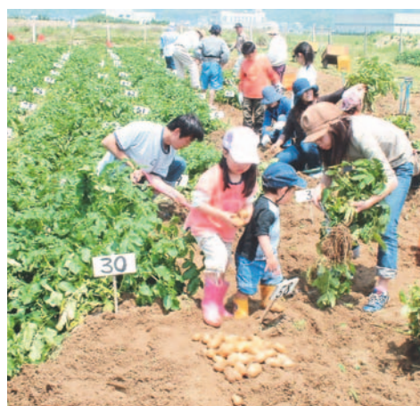
ジャガイモ集めに夢中です