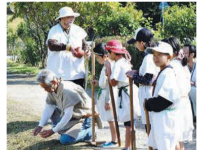
復元された水田では、春と秋に祭りが行われています。10月27日の「板付弥生のムラ秋祭り」は、「ムラ長」による収穫の儀式Ⅱ右写真Ⅱで始まり、450人の参加者が稲刈りや土器での炊飯、餅つきなどを楽しみました。

周辺には水田の跡も見つかり、近くの川から水路を引き込んだり、水路から田んぼへ水を流す井堰を設けたりするなど、当時の土木技術の様子も分かりました。