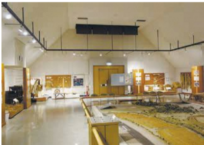
板付遺跡弥生館では遺跡の模型と大型画面の映像を見ながら楽しく学べます

【板付遺跡弥生館 施設情報】 〒板付三丁目21-1 ☎・㊟592-4936 ㊟無料 ㊟午前9時から午後5時(入館は30分前まで) ㊟12月29日から翌年1月3日