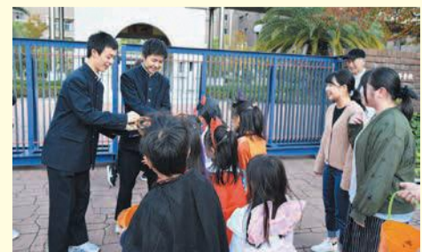
東福岡自強館じきょうかおんしん中学書道部の皆さんからお菓子をもらった子どもたち

思い思いの仮装やメイクをした子どもたちは、近隣の企業や公園などを回りお菓子をもらった後、公民館で写真撮影を行い、ハロウィーン気分を満喫しました。年代を超えた交流に、子どもたちはもちろん、スタッフや学生の皆さんにも笑顔があふれていました。