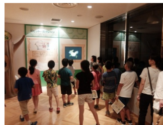
③見学者通路で学習