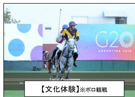
【文化体験】※ポロ観戦