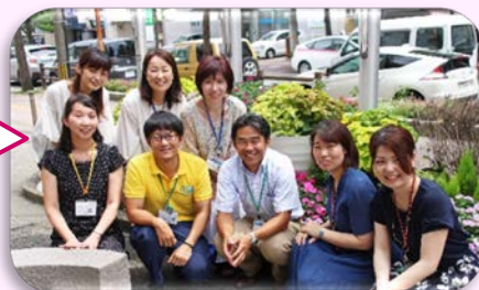
プロジェクトチーム