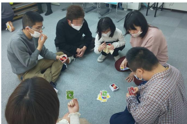
▲レクリエーション

当社では、今後も社員一人ひとりが輝き、働きがいと働きやすさを実感できる会社となるよう、社員と力を合わせ、積極的に働き方改革を推進して参ります。