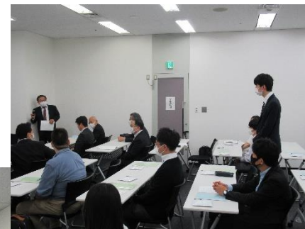
2023年度事業計画キックオフ 株式会社ソフト九州