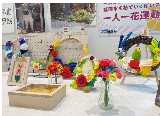
展示スペースの展示例