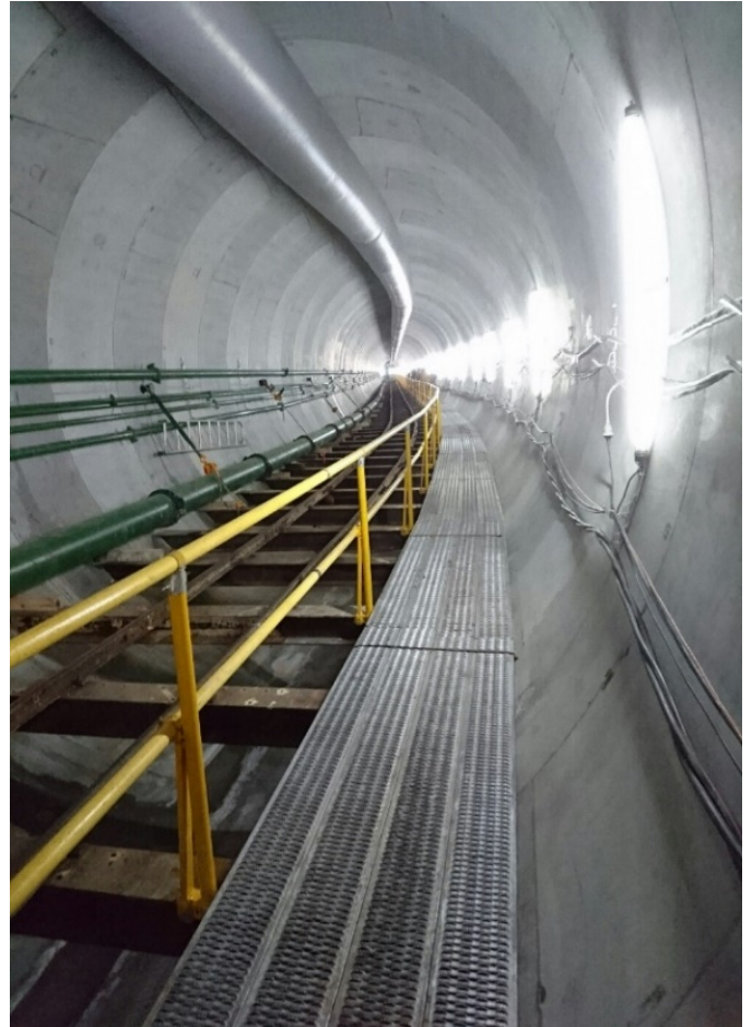
○雨水幹線トンネルの内部

地下 21 メートルからの光景は圧巻！ 行きは階段で，帰りはエレベーターで移動しました。