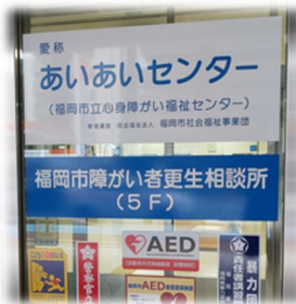
福岡市役所本庁舎

18歳以上の方の療育手帳の判定を担当します。知能検査の実施、日常生活能力の聴取等を通して、知的障がいの有無や程度を判定します。ちなみに18歳未満の療育手帳判定はこども総合相談センターが担当しており、連携する機会も多いです。