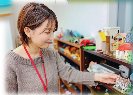
箱庭のミニチュアもたくさん!

学部卒での心理職の就職先を探し、生活に近い場所で寄り添った支援ができること等から福岡市役所の受験を決めました。