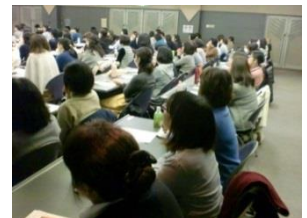
（熱心に講演を聞く学校司書）