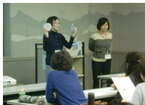
（マルチメディアDAISYの説明）