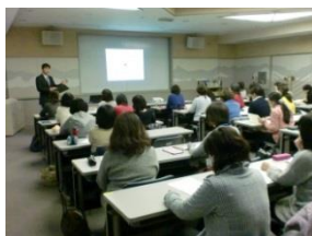
（学校指導課の説明）