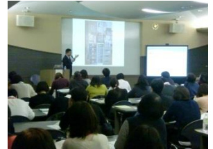
（図書館備品の実際の説明）

連絡会終了後、多くの学校司書が、学校図書館支援センターの展示した本を見たり、読書相談員から説明を聞いたりしていました。とても有意義な研修会でした。