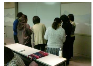
（展示された本を見る学校司書）