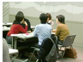
（グループに分かれて情報交換）